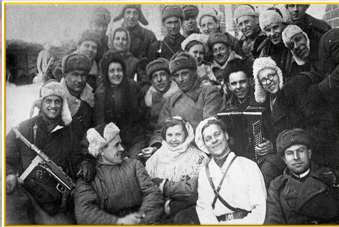
Концерт артистов и солдат на передовой.

Более трех тысяч фронтовых концертов дала на передовой и в госпиталях прекрасная актриса Нина Сазонова . А первое ее выступление перед бойцам прошло на Белорусском вокзале 22 июня 1941 года, куда ее отправили прямо с репетиции Театра Красной армии. По воспоминаниям Нины Афанасьевны, она растерялась - не могла понять, зачем плачущим женщинам и уходящим на фронт мужчинам нужны ее пение. Но сначала затянула народные песни, а потом - частушки! Тогда стало ясно - музыка на фронте тоже нужна.