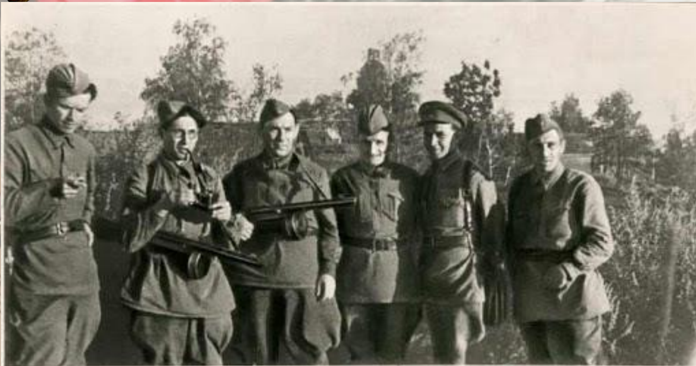
Л. Утесов на Калининском фронте 1942 г. Утесов 3-й слева.

Леонид Утесов награжден медалями «За победу над Германией в Великой Отечественной войне 1941 - 1945 гг.», «За доблестный труд в Великой Отечественной войне 1941 - 1945 гг.».